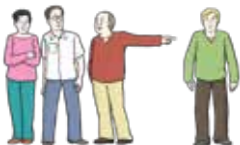
Die Menschen hatten viel Streit. Viele wollten besser sein als andere Menschen.