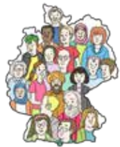
Gut zusammen leben.