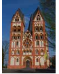
Der Dom von Limburg.

Ein Priester ist ein Seel-Sorger. Er wird vom Bischof geweiht. Das nennt man auch Priester-Weihe. Ein Pfarrer ist der „Chef“ von einer Pfarrei. Ein anderes Wort für Pfarrer ist Priester. Er erzählt in der Kirche von dem Wort Gottes. Er feiert zusammen mit den Gemeinde-Mitgliedern Gottes-Dienste.