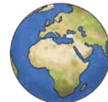
Welt-Kirche ist im Bistum Limburg wichtig.