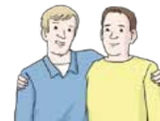
Menschen aus den Dörfern Strandorf und Ruppach- Goldhausen besuchen sich oft.