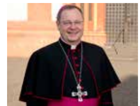
Alle sind wichtig. Viele Menschen kämpfen dafür. Diesen Menschen sage ich: Danke!