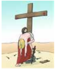
Jesus ist am Kreuz gestorben.