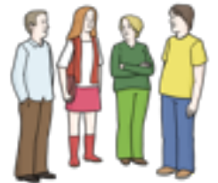
Kirche sind Menschen.