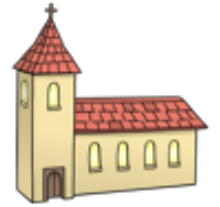
Kirche ist ein Haus.

Die Pallottiner sind eine Gemeinschaft. Oft leben sie in einem Haus zusammen. Sie wollen so leben wie Jesus. Pater Henkes war ein Pallottiner. Es gibt auch Frauen, die so leben. Diese Frauen heißen Pallottinerinnen.