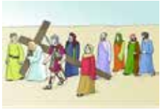
Jesus trägt sein Kreuz.