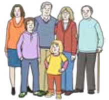
Alle sind wichtig.