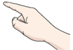
Wir können zeigen: Gott ist auch heute bei uns.