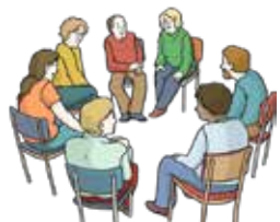
Ihr sollt gut mit-einander leben.